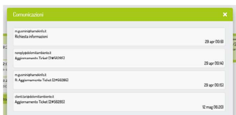
Interfaccia comunicazioni su Garbage

Attraverso la compilazione di una form sullo Sportello On-line o dalla APP SottoControllo, il contribuente può effettuare una segnalazione. Da questa richiesta scaturisce l'invio di una mail di conferma al contribuente e innesca l'avvio di un ordine di lavoro con la relativa comunicazione associata.